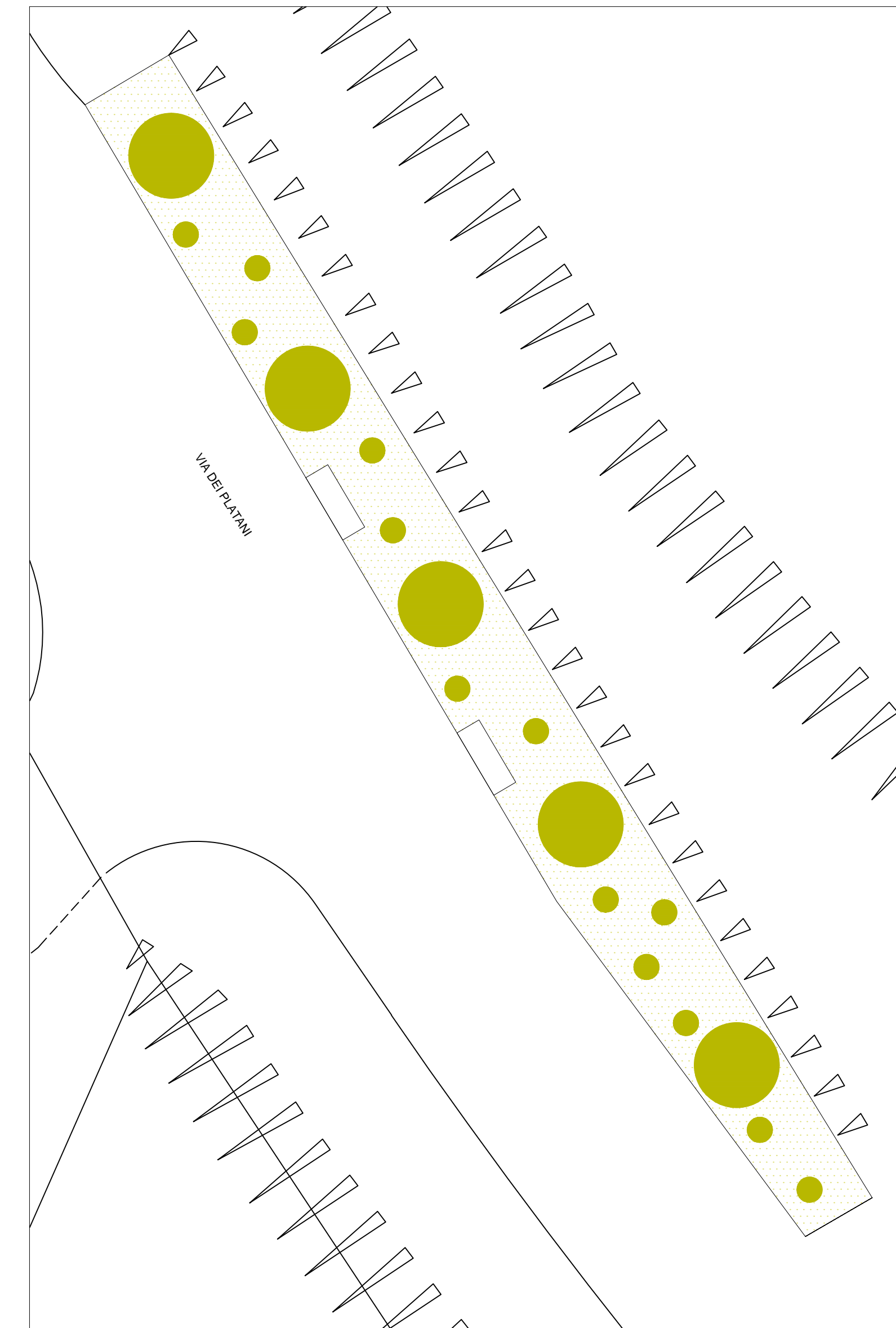
Intervento A Via dei Platani - frazione di Seuni _ 1:100