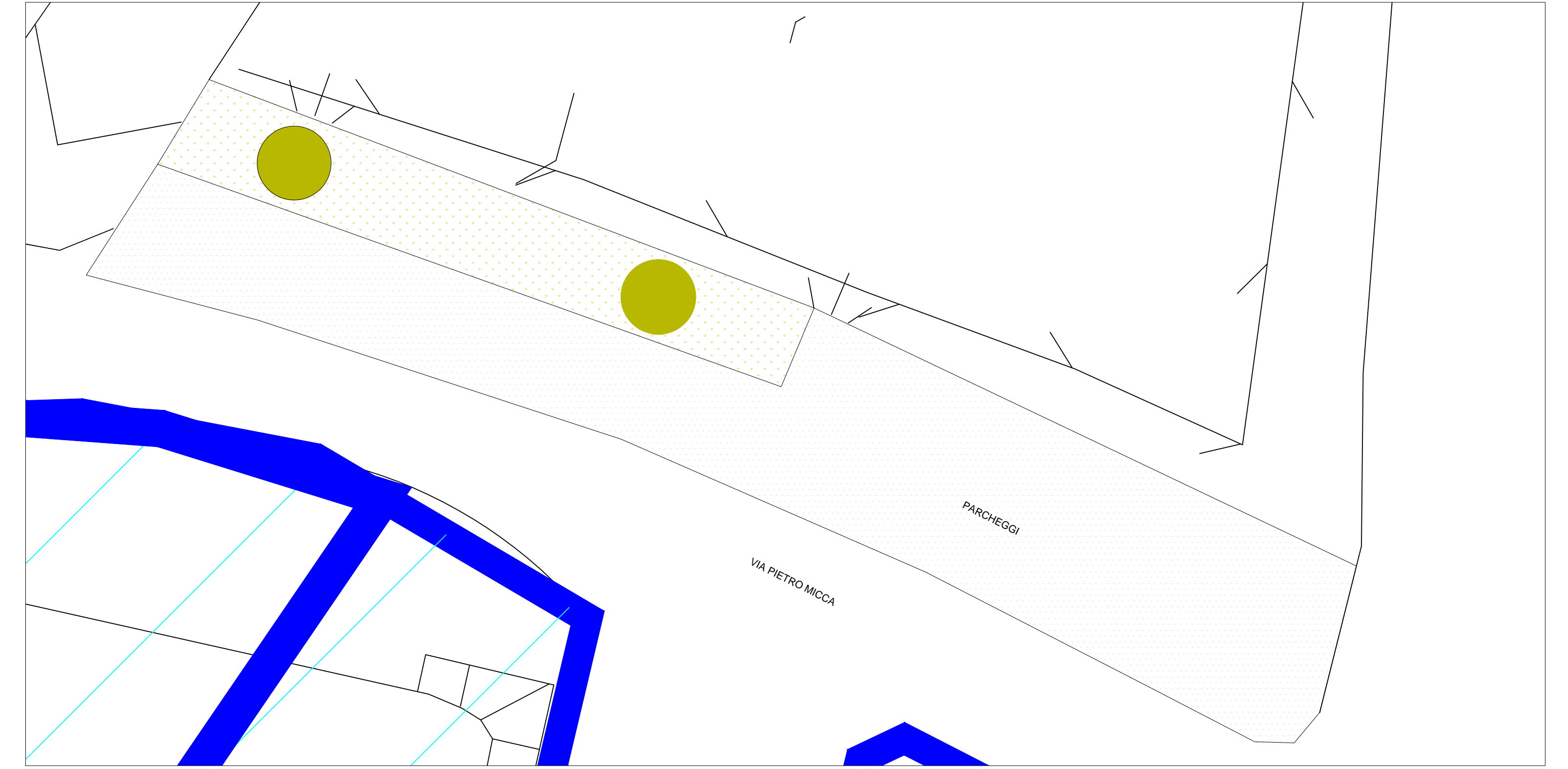
Intervento C Via Pietro Micca _ 1:100